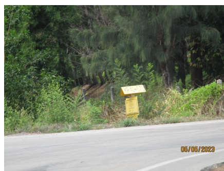
ภาพที่ 2-2 ป้ายแสดงตำแหน่งแนวท่อส่งก๊าซธรรมชาติ