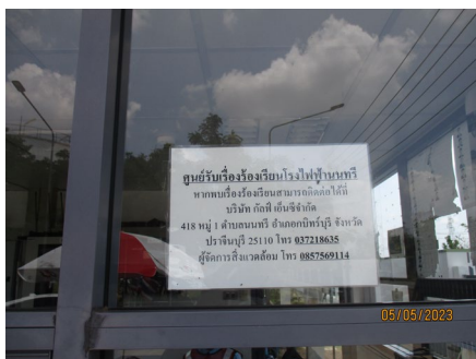
ภาพที่ 2-1 ศูนย์รับเรื่องร้องเรียน