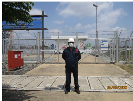
ภาพที่ 2-5 พนักงานสวมใส่อุปกรณ์คุ้มครองอันตรายส่วนบุคคล